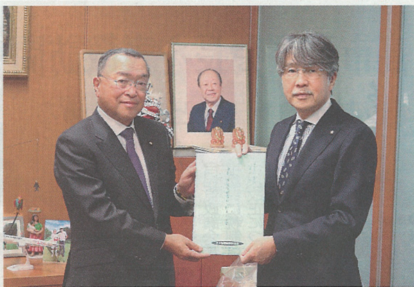
宮沢洋一 自民税調会長(左)と太田会長

「令和4年度税制改正 各項目に関して要望する最重要要望」におけることを申し合わせた。目である、適格請求書等保存方式の見直し及び「災害損失控除」の創設等、税理士法改正については、国民・納税者の信頼に込め得る陳情を行い、要望実現に向けて理解を求め、理士法改正要望書の